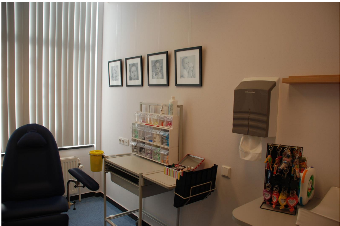
Zo ziet de kinderprik kamer eruit.