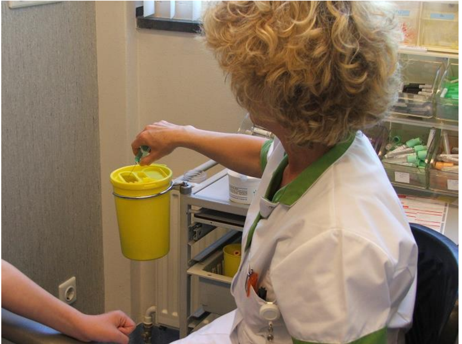
De prikzuster gooit de naald weg in een bakje.