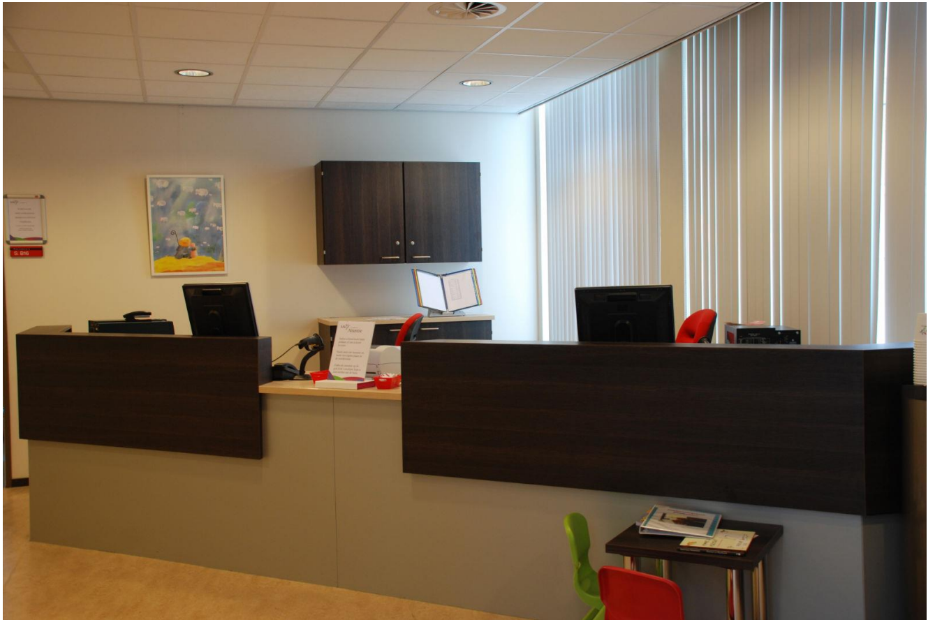
Dit is de balie van het priklaboratorium.